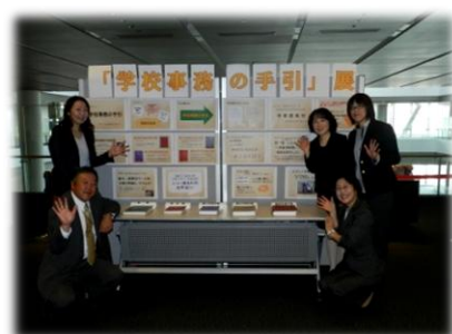
編集委員の皆さん

手引展では、貴重な初版から第四次改訂版までが実際に展示され、手に取った皆さんから「自分の生まれた年に発行されている!」「表紙の色、懐かしいね」との声も聞かれました。