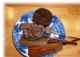
静岡おでんと清水もつカレー