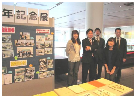
記念展と記念誌編集委員のみなさん

編集委員会を招集することができない多忙な時期にも作業が停滞しないように、クラウドを使って都合がつく時にいつでも作業ができるように設定もしました。期限が迫ってきて夜8時過ぎまで会議をした日もありました。今、無事に発刊できて、やっと気持ちが落ち着いてきました。発刊後に、記念誌を読んだの感想等が寄せられてきて、「苦しかったけれども、本当にやってよかった！」という想いで一杯です。関わってくださった全ての皆さんに感謝します。この50周年記念誌が、県事研と学校事務職員の“これから”に、少しでも役立つことを願っています。