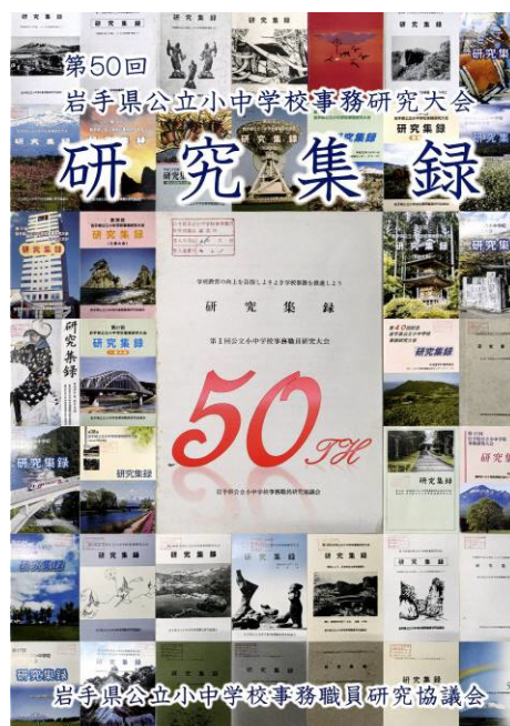
<第50回岩手県公立小中学校事務研究大会 研究集録表紙>

任命権者は岩手県教育委員会となり、市町村教育委員会の内申により任免やその他の進退が行われます。（地教行法第37条、第38条）また、勤務時間などのサービスの監督は市町村教育委員会が行うこととなります。（地教行法第43条）