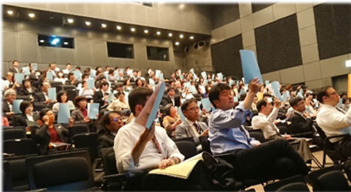
<第49回岩手県公立小中学校事務研究大会 全体研究会>