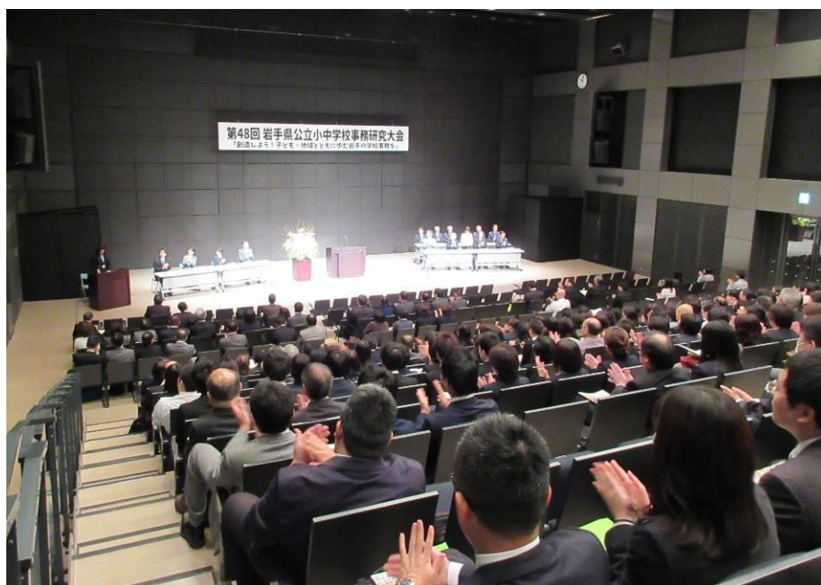
<第48回岩手県公立小中学校事務研究大会 開会行事>

任命権者は岩手県教育委員会となり、市町村教育委員会の内申により任免やその他の進退が行われます。（地教行法第37条、第38条）また、勤務時間などのサービスの監督は市町村教育委員会が行うことになります。（地教行法第43条）