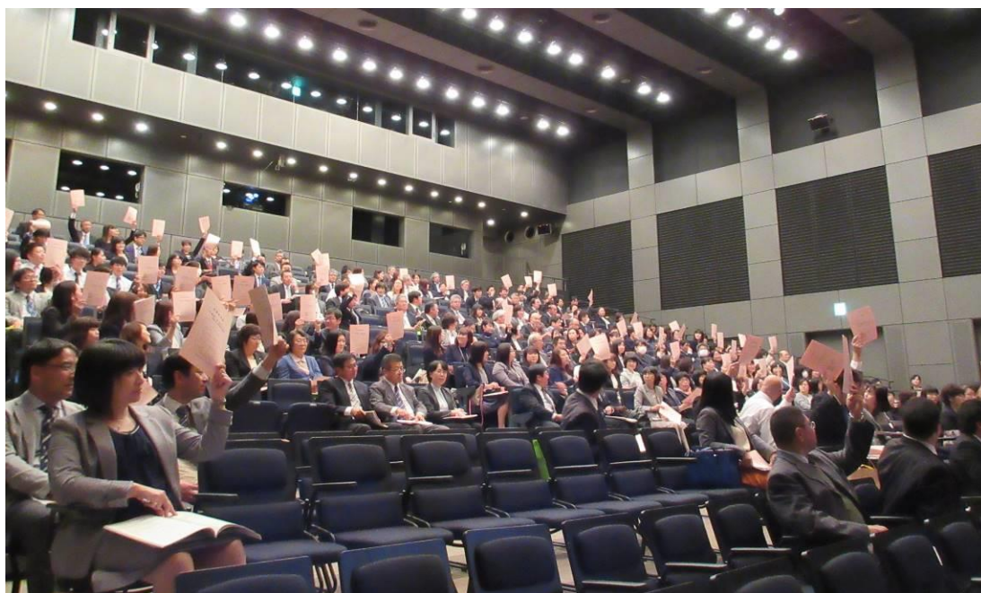
<第48回岩手県公立小中学校事務研究大会 全体研究会>